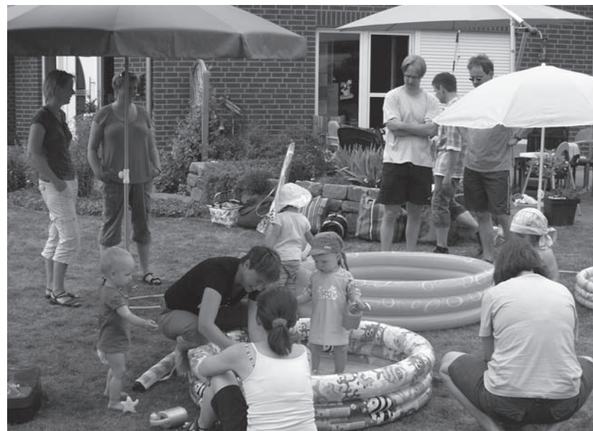
Die Gruppe „Junge Familien“ bei einem sommerlichen Treffen mit Planschbecken.

Vor zwei Jahren fing alles an. In der Kolpingsfamilie Belm wurde die Idee geboren, eine neue Gruppe „Junge Familien“ zu etablieren, da bei den bisherigen „jungen“ Familien die „Kinder“ nunmehr mit dem eigenen Auto zu den Treffen kamen.