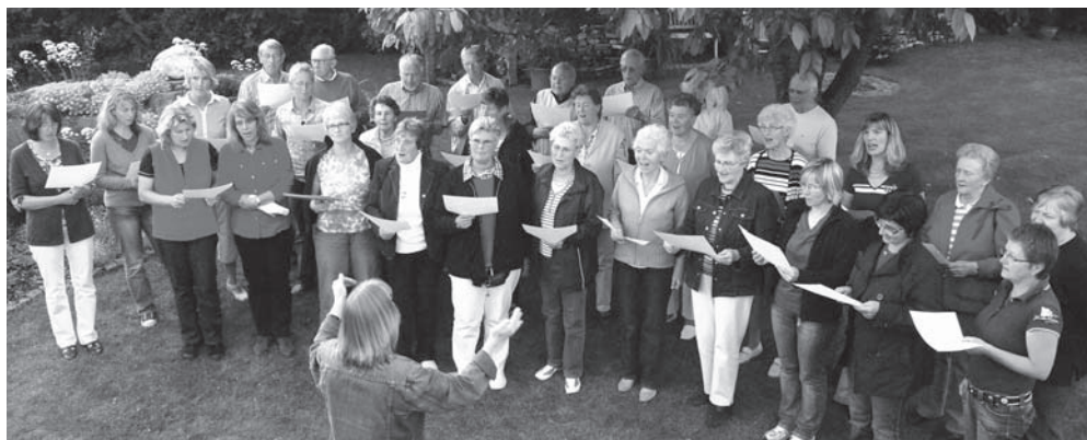
Der Kirchenchor wurde in diesem Jahr 80 Jahre alt (siehe auch Seite 21).

Ein fotografischer Rückblick auf das Jahr 2011