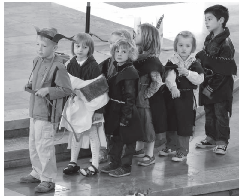
Palmsonntag: Kinder aus der Kindertagesstätte St. Josef stellen den Einzug Jesu in Jerusalem dar.