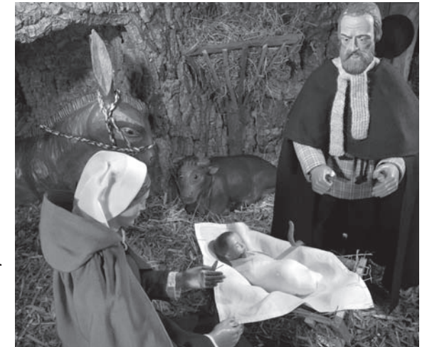
So sieht die Heilige Familie in der Belmer Krippe aus.

Der Aufbau beginnt am Freitagnachmittag vor dem ersten Advent, damit pünktlich zum Start des Weihnachtsmarktes am Samstag alles fertig ist. Zu sehen sind zunächst nur die Hirten und ihre Schafe. Die Krippenlandschaft, zu der auch ein unterschiedlich gestaltbarer Torbogen (zum Beispiel für die Herbergssuche oder