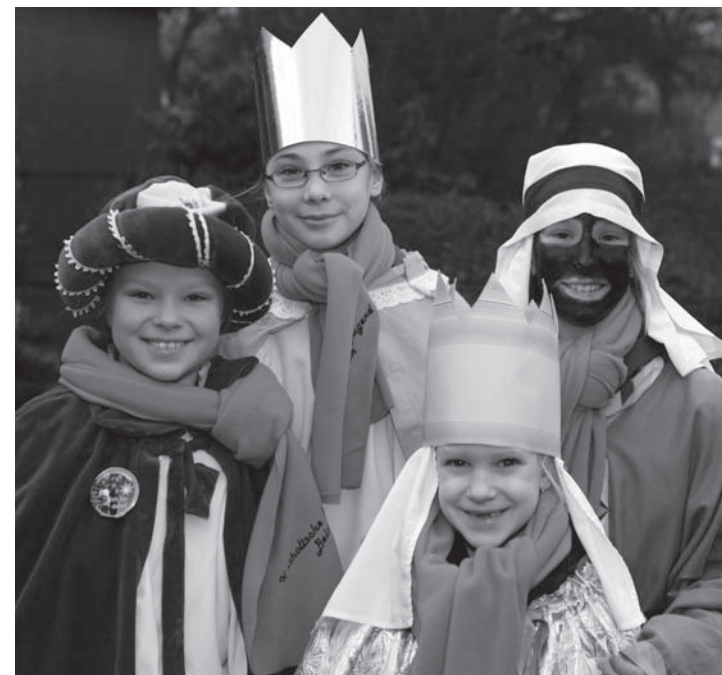
Diese Sternsinger waren Anfang des Jahres in Belm unterwegs.

Die Sternsingeraktion 2012 findet am Sonntag, dem 8. Januar statt! Dazu brauchen wir 100 „Kinder“ und 30 „Gruppenleiter“! Also komm' und klopft an Belmer Türen und setz' dich ein für Kinder und Jugendliche in Nicaragua und überall auf der Welt! Melde dich möglichst schnell, gerne auch gruppenweise, unter E-Mail: sternsingerbelm@gmx.de oder per Telefon: 39 91 (Erika Hartkemeyer) oder 89 99 56 (Regine Gelhot)