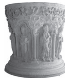
Taufstein in der Pfarrkirche

Die Taufgespräche zur Vorbereitung auf die Taufe finden an zwei Abenden statt, für Belmer und Ickeraner gemeinsam: in den ungeraden Monaten in Belm, in den geraden Monaten in Icker, jeweils um 20 Uhr