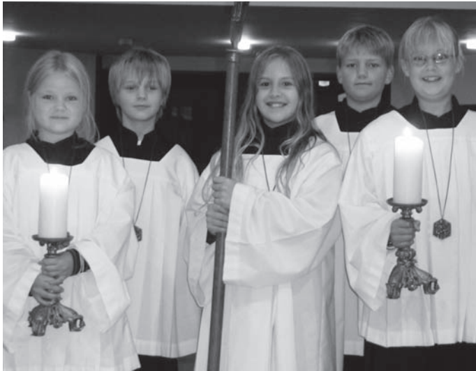
Zahlreiche Kinder sind in Belm als Ministranten aktiv.

Eine „bunte Ministrantenschar“ dient in den Gottesdiensten