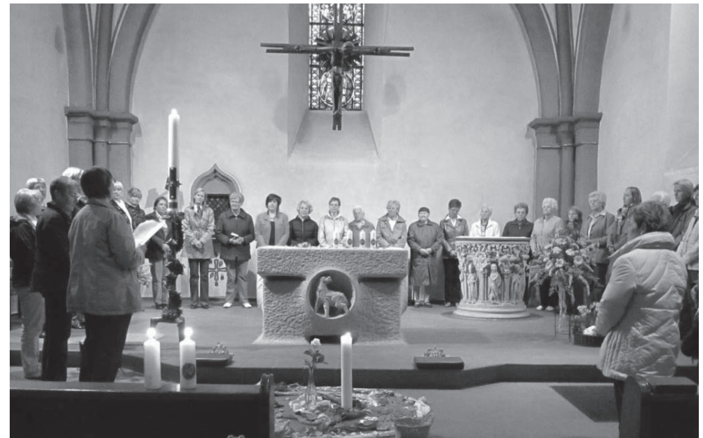
Wortgottesdienst vor der Jahreshauptversammlung.