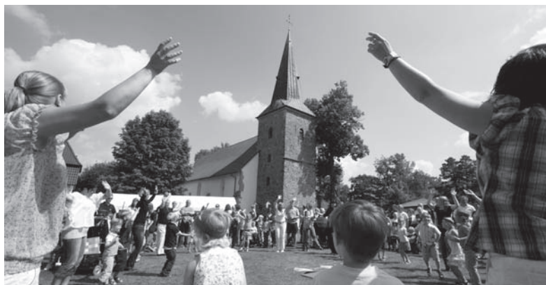
Beim Pfarrfest gab es viele Angebote für Jung und Alt.