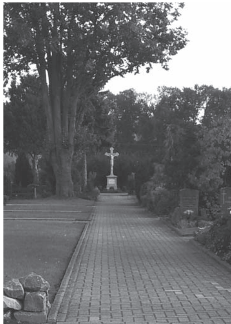
Hauptweg auf dem katholischen Friedhof.