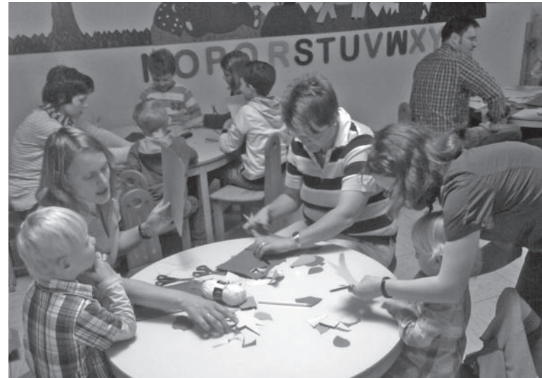
Das Kinderkirchenteam bei der „Arbeit“.

Eine fünfköpfige Frauengruppe bereitet den Gottesdienst für die Kleinen vor