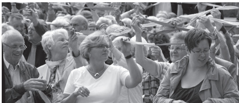
Verbindungen knüpfen beim ökumenischen Pfingstgottesdienst auf dem Marktplatz.