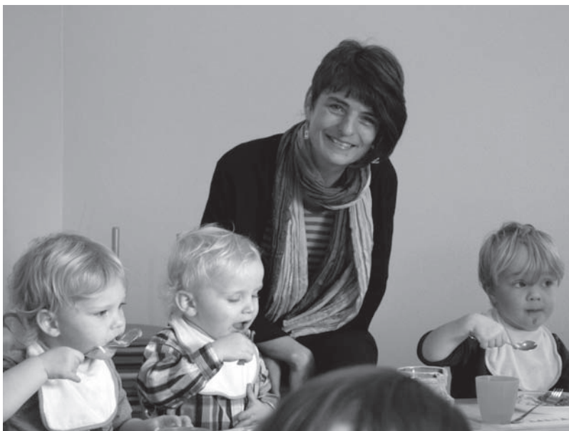
Jetzt werden in der Kindertagesstätte St. Josef auch Kinder unter 3 Jahren betreut.

Anbau einer Kinderkrippe an das „Haus für Kinder und Familien“