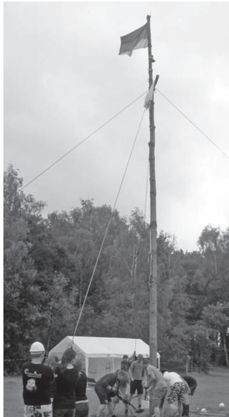
Mittelpunkt jedes Zeltlagers: der Fahnenmast.

Wenn es in den Vortrupp geht, werden Fahrer organisiert, LKW beladen und zum Zielort gefahren. Dann geht die Arbeit los: Zelte aufstellen, teilweise bis zu 1,5 Kilometer Starkstromkabel verlegen, alle Kü-