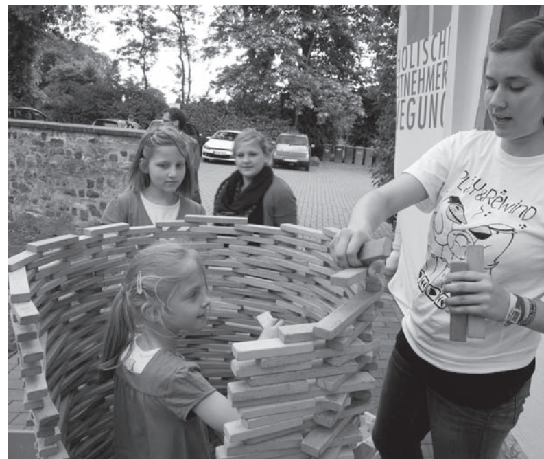
Eine Aufnahme vom Diözesanfamilientag der KAB.