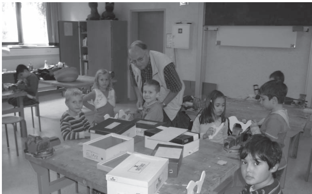
Jung gebliebene Senioren helfen den Kindern beim Umgang mit Säge, Bohrer und Farben.